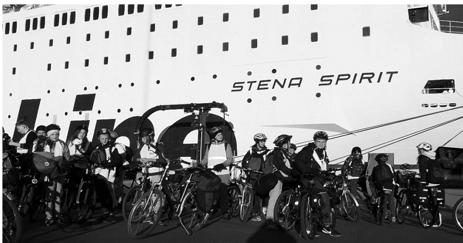
Ryc. 2. Wycieczka rowerowo-promowa młodzieży ZSO 3 w Słupsku do Karlskrony w Szwecji