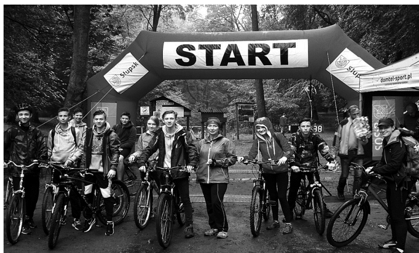
Ryc 3. Wycieczka rowerowa młodzieży ZSO 3 do Ustki

Należy podkreślić, że wybierając ofertę imprezy turystyczno-krajoznawczej, nauczyciele szukają promocji i sponsorów, aby cena dla młodzieży była przystępna. Jednodniowe wycieczki na terenie Słupska lub w jego pobliżu odbyły się z wykorzystaniem w 50,2% miejskiej komunikacji autobusowej (131) i w 34% pieszo (88). Autokary firm przewozowych były wykorzystywane 20 razy (7,7%), koleją (pociąg PKP, SKM) odbyło się 8 wyjazdów (3,1%), a busem – 7 imprez (2,7%).